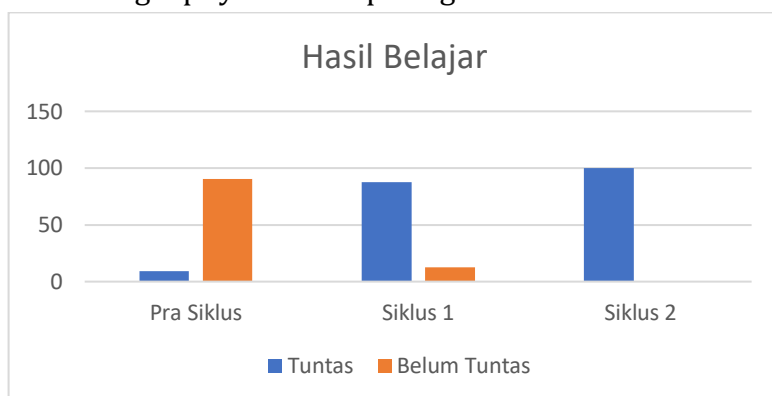
Gambar 4. 2. Grafik Hasil Belajar Peserta Didik

kedua, seluruh peserta didik (100%) mencapai tingkat ketuntasan hasil belajar. Lebih lengkapnya terlihat pada grafik berikut: