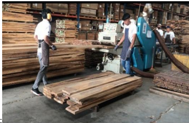
Gambar 1. Proses memasukkan kayu ke mesin sebelum perbaikan

Penilaian postur kerja menggunakan metode OWAS dilakukan dengan menganalisis aktivitas kerja, khususnya pada proses memasukkan lempengan kayu ke mesin double planer, yang dijelaskan sebagai berikut: