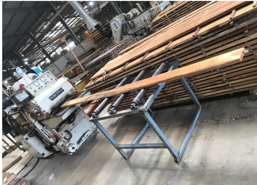
Gambar 4. Bentuk Meja roller dan tumpukan kayu/pallet yang meringankan operator mesin memasukan kayu ke mesin.