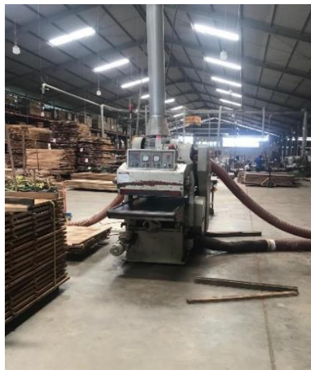
Gambar 2. Tumpukan kayu atau pallet diatas lutut sebelum perbaikan